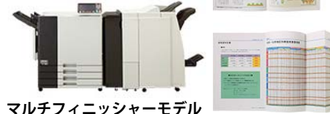
マルチフィニッシャーモデル