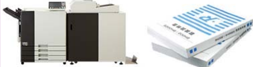
くるみ製本フィニッシャーモデル