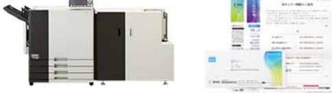
メーリングフィニッシャーモデル